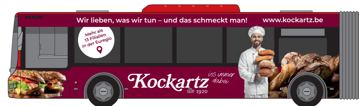
Abbildungen zeigen Beispiele für mögliche Werbeanbringungen. Bis zu 30% der Scheiben sind beklebbar